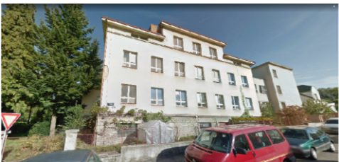
dříve: Průmyslová škola pokračovací Nové Město nad Metují (odborná obvodová škola Živnostenská)